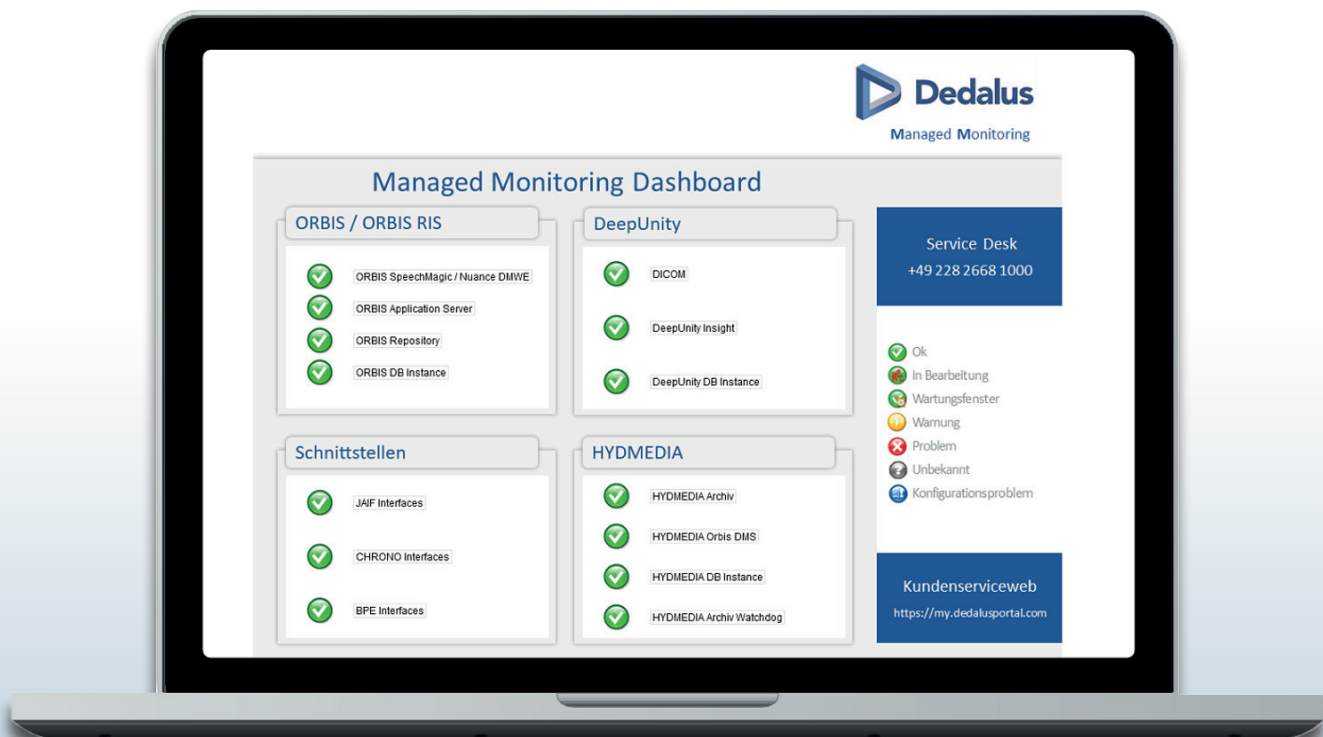
Managed Monitoring: Übersichtliches Dashboard

Dies stellt einen entscheidenden Vorteil gegenüber einer Standardüberwachung aus Sicht des Betriebssystems dar. Das Ergebnis ist Kontrolle und gewonnene Sicherheit.